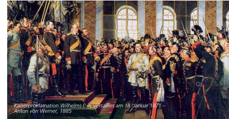
Kaiserproklamation Wilhelms I. in Versailles am 18. Januar 1871 – Anton von Werner, 1885